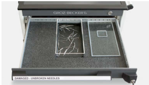
Schublade 1: Behälter für beschädigte und gebrauchte Nadeln; mit separatem Verschlusssystem gesichert

Der abschließbare Nadelausgabewagen verfügt über mehrere Schubladen, die folgendermaßen ausgestattet sind: