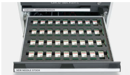
Schublade 2: Aufbewahrungsplatz für neue Nadeln