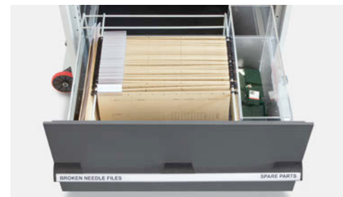
Schublade 6: Hängeregister zur Aufbewahrung der Dokumentation von Nadelbrüchen sowie Sammelbehälter für leere Verpackungen