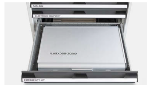
Schublade 5: Platz für ein optionales „Notfallset“, das neue Nadeln sowie verschiedene Werkzeuge enthält, um einen zweiten Nadelaustausch vorzunehmen