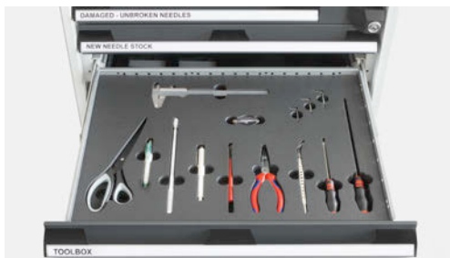
Schublade 3: Aufbewahrungsplatz für benötigte Werkzeuge; für weiteres Werkzeug kann der Schaumstoff individuell zugeschnitten werden